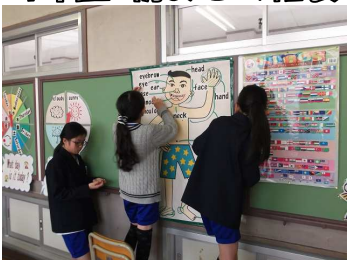
1年生が 英語教室を作りました