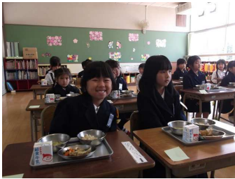
とってもおいしいよ！ ～1年生 初めての給食～