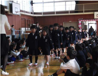
1年生朝会デビュー